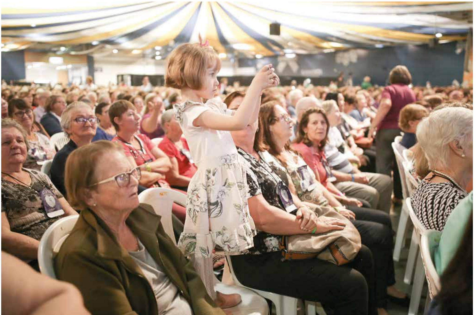
Vindas de todo o Brasil para comemorar os 120 anos da OASE, as mulheres experimentaram entusiasmo, encontro, comunhão, celebração pela história e projetos para o seu futuro.