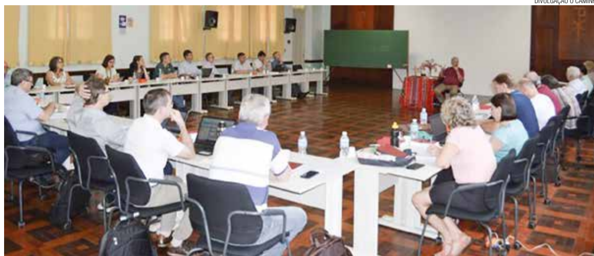
A Presidência reuniu-se em Porto Alegre com pastores e pastoras sinodais dos 18 sínodos da IECLB.

A segunda meta estabelecida é buscar uma igreja aberta, que proclame o evangelho de modo contextualizado, em favor das pessoas e da criação de Deus. O culto e a comunicação serão áreas de ação prioritária, buscando a renovação e o fortale-