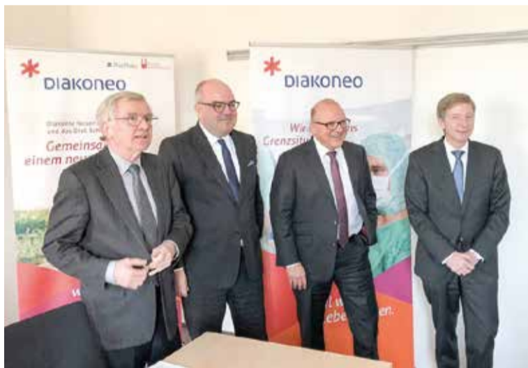
As lideranças das entidades fundidas, no lançamento de Diakoneo.

Apesar do gigantismo, a igreja afirma que a fusão da