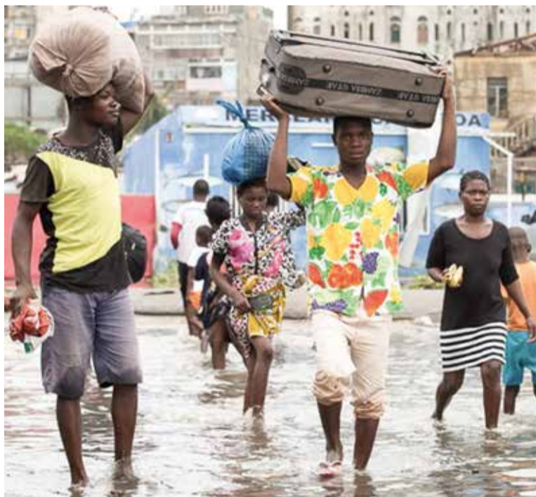
Mais de 800 mil pessoas no país foram afetadas pelo Ciclone Idai.

A IECLB tem longa parceria com a Igreja Evangélica Luterana em Moçambique. Ao longo dos tempos, pudemos compartilhar mutuamente os dons que Deus nos deu. Diante desta catástrofe, fazemos um chamado especial às Comunidades da IECLB para exercer solidariedade e amor.