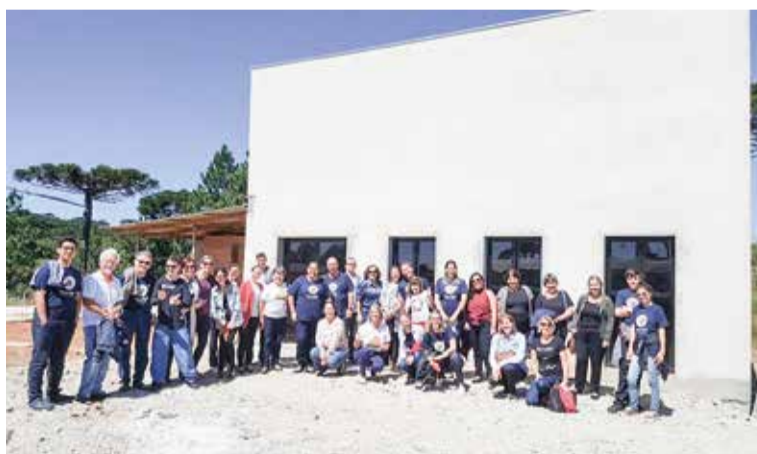
Participantes do seminário em visita ao canteiro de obras.

Queridas e queridos! Precisamos de mais mãos, de mais cabeças pensantes. É possível contribuir dos mais diversos jeitos neste Projeto