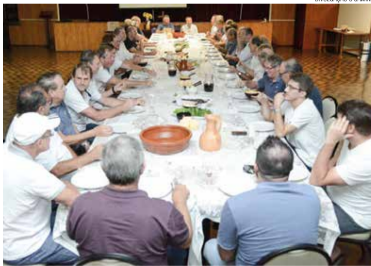
A oficialização foi seguida de jantar que celebrou a Páscoa judaica.