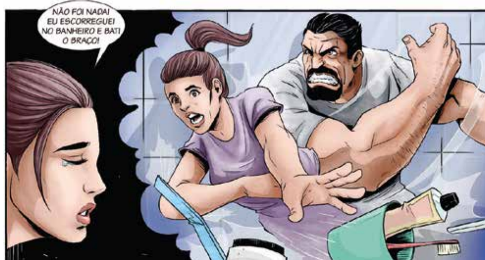
O gibi Valentina está à disposição de grupos e comunidades que queiram fazer uso do material para combater a violência doméstica. A solicitação de exemplares deve ser feita através do e-mail oasenacional@luteranos.com.br.

Valentina é o nome da personagem principal do enredo familiar do HQ, que tem por objetivo refletir e auxiliar na superação da violência contra as mulheres. “O nome já demonstra que é necessário sermos valentes e corajosas para abordar este assunto carregado de tabus e frases,