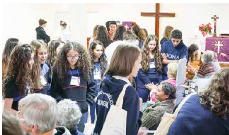
Os estudantes puderam debater e experimentar diaconia.

Os estudantes tiveram contato com Laura, primeiro robô cognitivo gerenciador de riscos do mundo, capaz de identificar infecções e salvar pacientes.