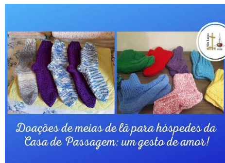
Doações de meias de lã para hóspedes da Casa de Passagem: um gesto de amor!

29.05.20, pela solicitação da São Lucas, foram arrecadados, em dinheiro, R$ 14.027,40. Recebemos, também, em remédios, o equivalente a R$ 1.720,00. Em uma oferta de gratidão destinada pela São Lucas para a Casa de Passagem recebemos R$ 1.025,04 e adquirimos três ventiladores de teto. Todo esse apoio fez muita diferença para a manutenção da Casa e para a qualidade de vida de quem esteve na CP, neste período.