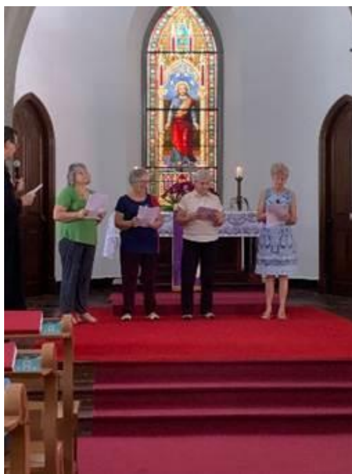
Comunidade em Petrópolis, RJ

5. Dia Mundial de Oração/2024, Vale do Paraíba, SP: Como é tradicional, na primeira sexta feira de março de cada ano, celebramos o Dia Mundial de Oração. O DMO é um movimento que reúne mulheres cristãs de diversas tradições, de mais de 170 países e regiões. A diversidade de raças, culturas e tradições é o grande diferencial.