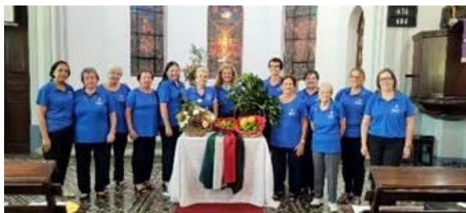
Comunidade Rio Claro, SP