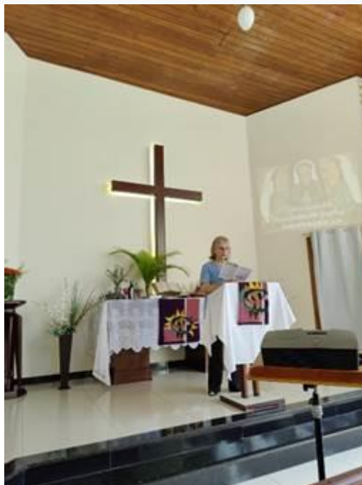
Comunidade em Ferraz de Vasconcelos, SP