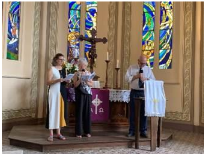
Comunidade Martin Luther, Centro, SP