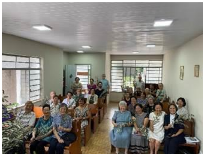
Comunidade Nipo Brasileira, SP

Presidente OASE Sinodal – Sínodo Sudeste