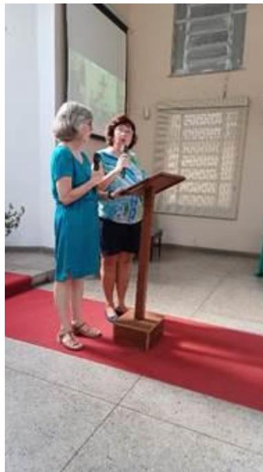
Comunidade Bom Pastor, Ilha do Governador, RJ