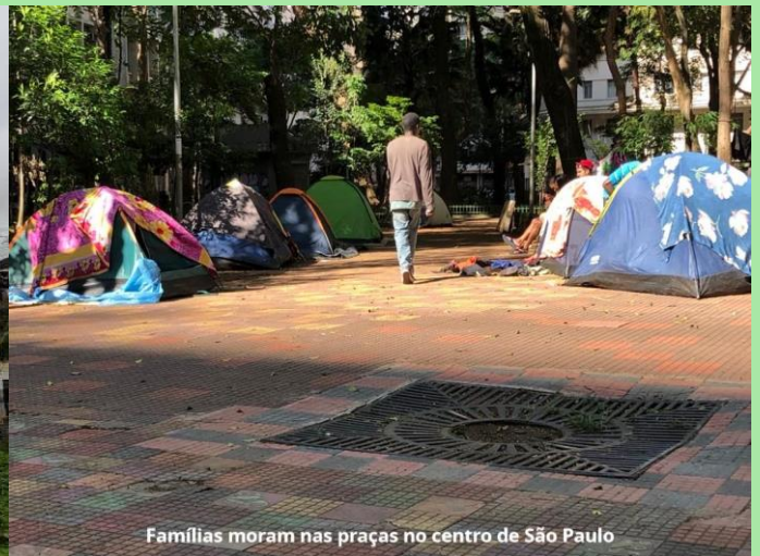
Famílias moram nas praças no centro de São Paulo