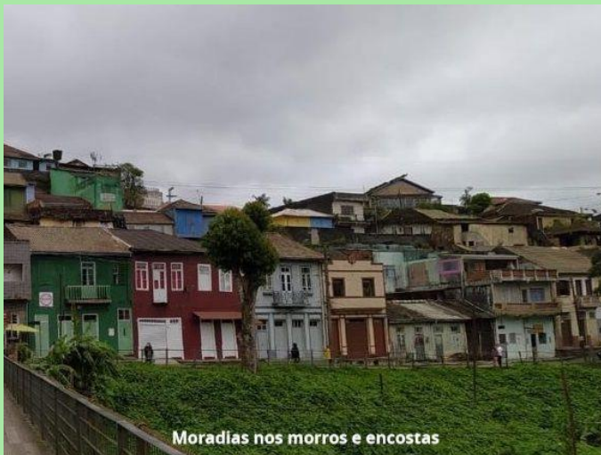
Moradias nos morros e encostas

Estamos na semana da reforma. São 503 anos da redescoberta do Evangelho. A IECLB decidiu-se por ser Igreja que é orientada pelo Evangelho na forma Luterana de Confessá-lo NO Brasil, assumindo as consequências inerentes do ser igreja em solo brasileiro. No pitaco de pastoral urbana desta semana lembramos das condições de moradia das pessoas. Ter um lugar digno para reclinar o corpo é, além de direito humano, um desejo de Deus. A pandemia e o consequente empobrecimento da população brasileira só fez por agravar esta situação. Ore e faça o que está ao alcance da tua mão (M. Lutero).