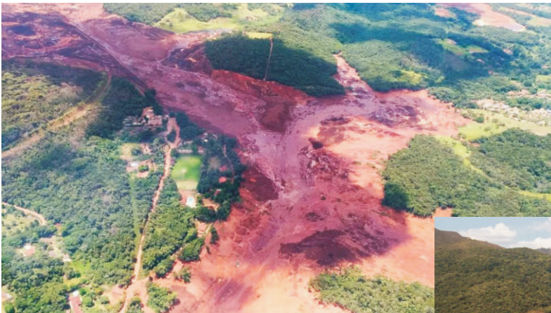
Imagem da internet

c) Com o material coletado, informações sobre situações que precisam de ajuda para mudar, confeccionar cartazes. Colar a informação que trouxe e, ao lado, sugerir ações para mudar isso. Podem ser ações que as próprias crianças podem realizar ou que elas desejam que possam se concretizar por meio de outras pessoas.