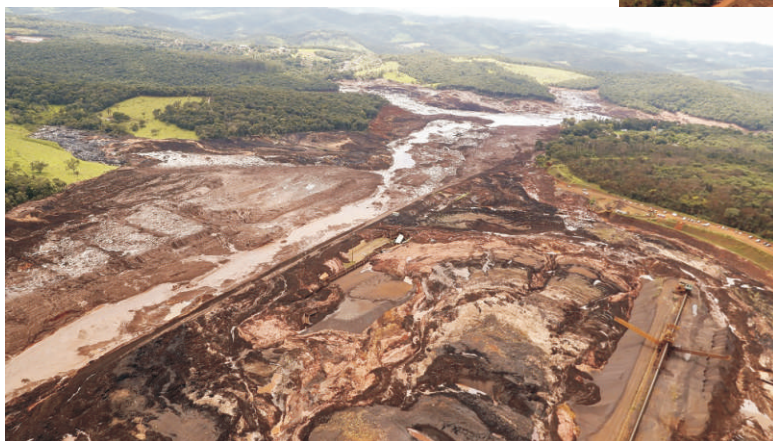
Imagem da internet