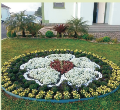
Canteiro da Rosa de Lutero na Comunidade Evangélica de Confissão Luterana em Arroio do Meio, Rio Grande do Sul

1) Com a ajuda das crianças e de outras pessoas ou grupos da comunidade, construir um canteiro de flores em forma da Rosa de Lutero: